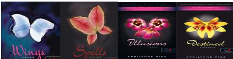
Wings (szárnyak), Spells (varázsigék), Illusions (Illúziók), Destined (elrendelve)

Garfield jelleme tökéletes. Lusta, cinikus, elkényeztetett és nagyszájú. Egy macskától nem várható el több, de Garfield mindent elkövet, hogy jók között is a legjobb legyen. Ám a szerelem a legbiztosabbnak tűnő életet is képes felborítani. Ugyanis Jon, Garfield gazdája szemet vetett az állatgyógyász Lizre. Így Jon képtelen nemet mondani, amikor Liz megkéri, hogy fogadjon be egy kiskutyát, Odie-t. Garfield persze féltékeny és igyekszik Odie életét megkeseríteni. Csak hogy Odie-t elrabolják, így kénytelen egy új érzéssel megismerkedni, a lelkiismeret furdalással. Olyan dolgokba kezd, amelyen önmaga is megdöbben.